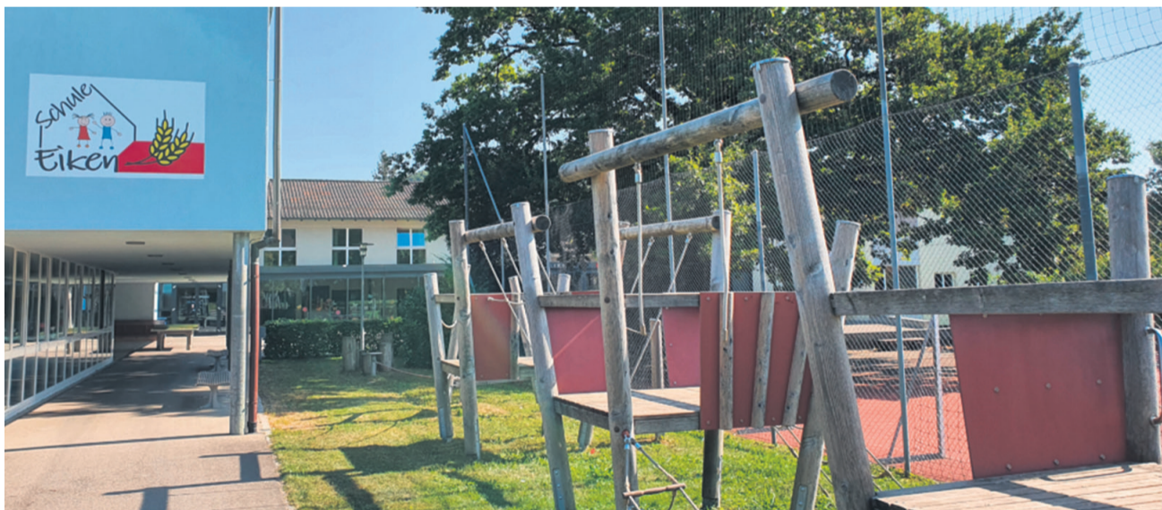
Temperaturen von über 34 Grad lassen einen geregelten Schulbetrieb nicht mehr zu.

Nach der Sitzung vom 8. Juni ist der Gemeinderat nun in einer umfassenden Güterabwägung zum Entschluss gekommen, den Ver-